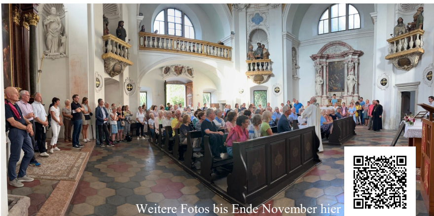
Weitere Fotos bis Ende November hier

Mit einer Dankesfeier wurde das gelungene Werk gefeiert und allen großzügigen Sponsoren und Spendern und allen an der Renovierung beteiligten Planern, Handwerkern und Betrieben herzlich gedankt.