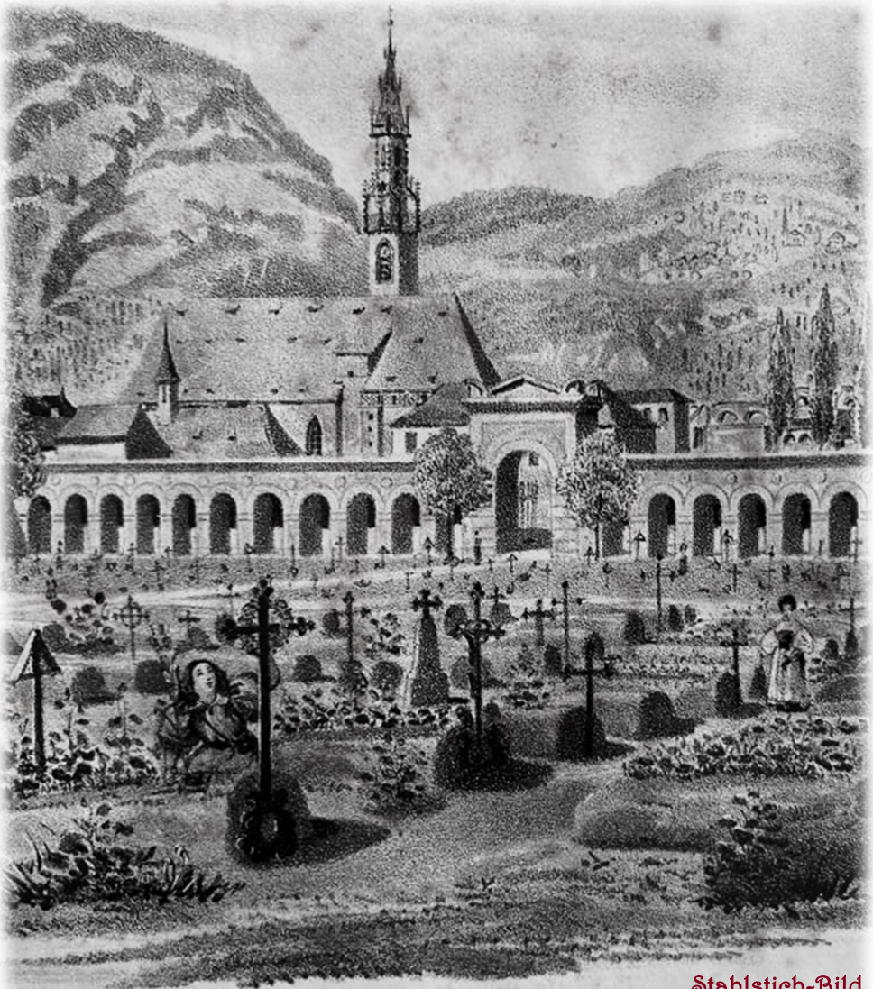
Stahlstich-Bild von Josef Teplý (ca. 1835) aus „Album von Tirol“